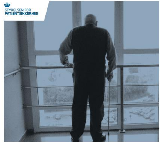
DEMENS OG ANTIPSYKOTISK MEDICIN Undervisningsmateriale til plejepersonale